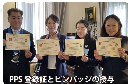
PPS登録証とピンバッジの授与