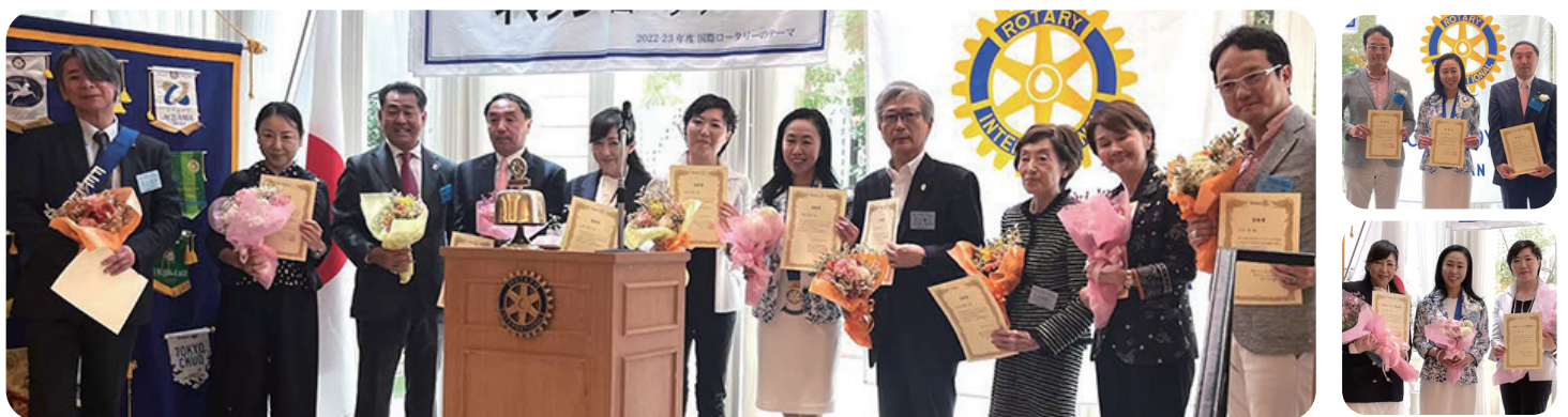
川崎年度皆勤賞、おめでとうございます！